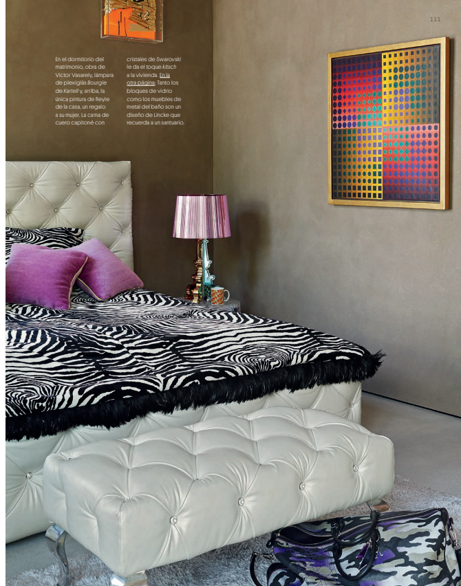
En el dormitorio del momento, obra de Victor Vasarely, muestra de momento. Después de Karim y Anita, la única pintura de Reyle en la casa, se refiere a su mujer. La cama de como caparazón con